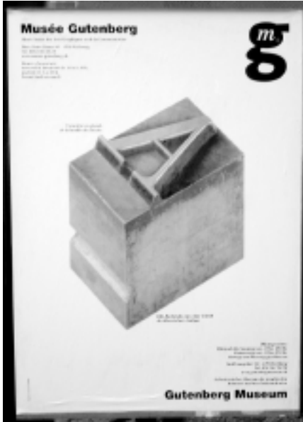
Au Musée Gutenberg.