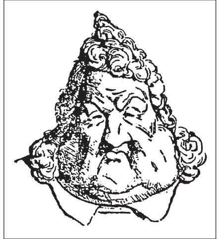
Louis-Philippe, par Charles Philipon.

Ce n'est qu'en 1881 – les républicains étant désormais majoritaires au Sénat – que fut votée la loi, devenue célèbre, qui abolissait l'ancienne législation sur la presse, instituant un régime très libéral qui fut à la base de toute législation démocratique sur le droit d'expression. Le résultat ne tarda pas à se faire sentir. Lorsque la loi fut votée, on comptait 3800 journaux en