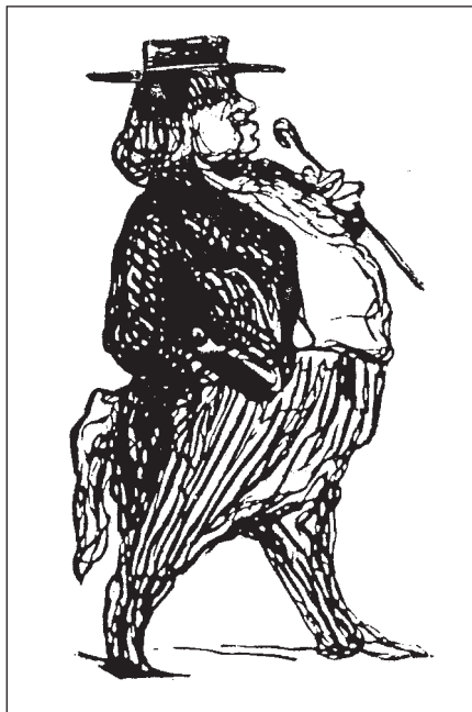
Honoré de Balzac, par Honoré Daumier.

Il faudra attendre la fin du XVI e siècle pour qu'apparaisse la caricature sous son sens initial impliquant les notions de ressemblance, de reproduction bouffonne, d'exagération et de charge. Et ce n'est que