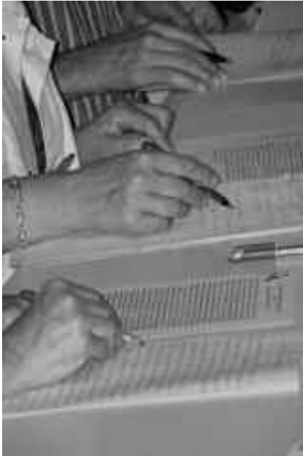
La correction des copies.