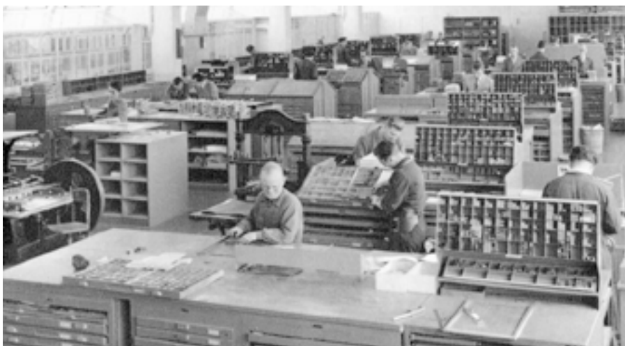
Un atelier de composition.

Après les inévitables flottements du début, notre petite imprimerie connut la