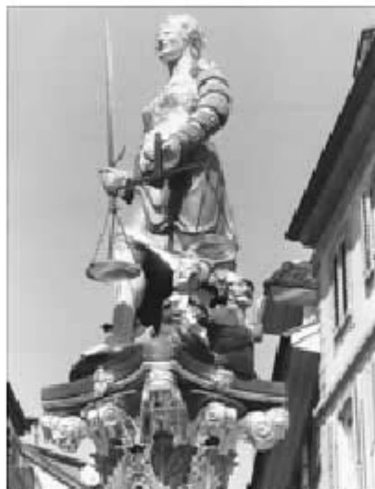
60 e Assemblée générale de l'Arci à Neuchâtel.